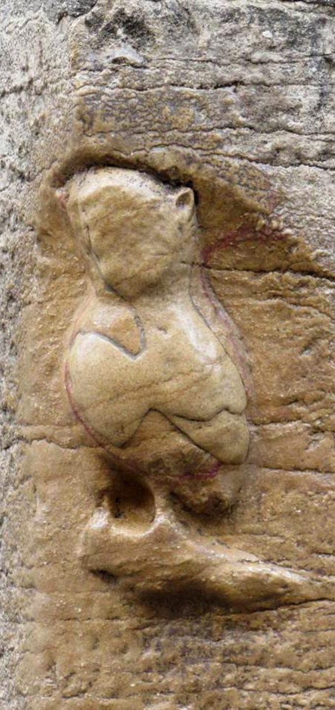
« La chouette de Dijon », détail sculpté sur un contrefort de l'église Notre-Dame de Dijon