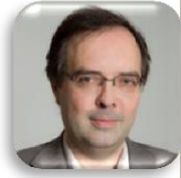
Philippe Walter Sorbonne-Université (UPMC), Paris