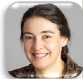
Clare Grey Université de Cambridge